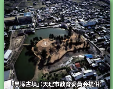
「黒塚古墳」(天理市教育委員会提供)

黒塚古墳は奈良県天理市柳本町に所在する全長約130mの前方後円墳で、国の史跡に指定されている。奈良県立橿原考古学研究所によって1997年から行われた学術調査で大きな成果があった。後円部から見つかった竪穴式石室は盗掘の被害も少なく、埋葬当時の状況が保存されていた。多くの副葬品が発見されたが、中でも三角縁神獣鏡が33面出土したことが特筆される。