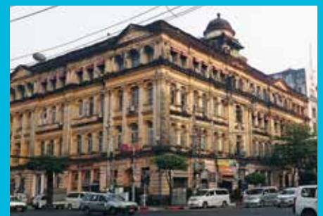
ヤンゴンの歴史的建造物(ミャンマー) Historical Building (Yangon, Myanmar)