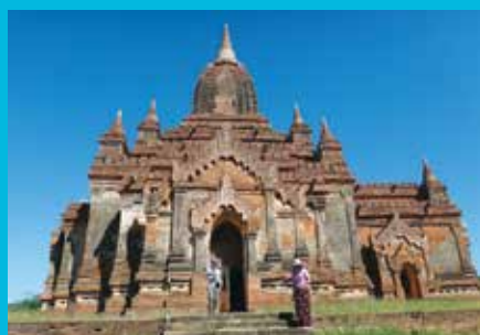
バガンのタンビューラ寺院(ミャンマー) Tumbula Temple (Bagan, Myanmar)