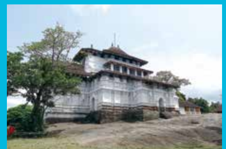
キャンディのランカティラカ寺院(スリランカ) Lankatilaka Temple (Kandy, Sri Lanka)