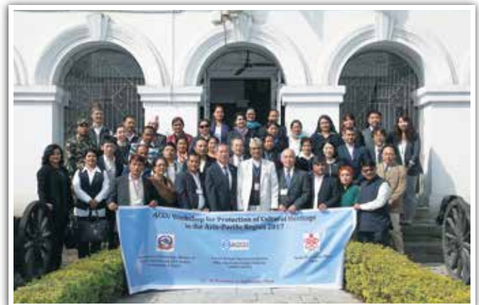
文化遺産ワークショップ(ネパール カトマンズ) Workshop for Cultural Heritage Protection in Kathmandu, Nepal

Since then, many experts in Asia-Pacific countries have participated in the training courses for human resources development, one of the ACCU Nara Office's leading programmes. These participants are active in their own countries for protection of cultural heritage with their newly acquired knowledge and techniques in the training course.