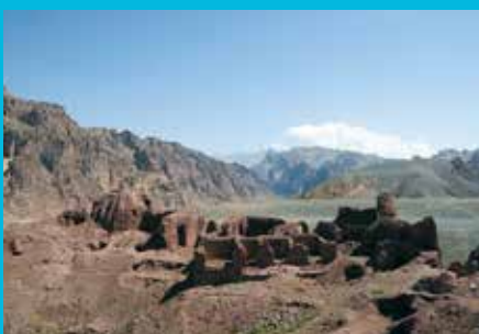
バミヤーンのシャフリ・ゾハック(アフガニスタン) Shahr-i-Zuhak (Bamiyan, Afghanistan)