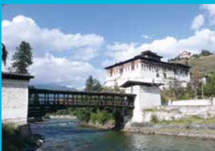
パロ・ゾン(ブータン) Paro Dzong (Paro, Bhutan)