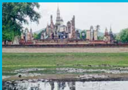
スコートタイのワット・マハタート寺院(タイ) Wat Mahathat (Sukhothai, Thailand)