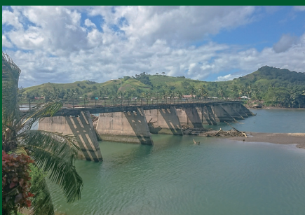
シンガトカ鉄道橋跡(フィジー) Railway bridge of Sigatoka (Fiji)