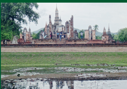
スコタイのワット・マハータート寺院(タイ) Wat Mahathat at Sukhothai (Thailand)