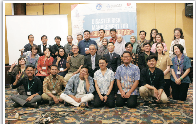
文化遺産ワークショップ(インドネシア ジョグジャカルタ) Workshop for Cultural Heritage Protection in Yogyakarta, Indonesia

Since then, many experts in Asia-Pacific countries have participated in the training courses for human resources development, one of the ACCU Nara Office's leading programmes. These participants are active in their own countries for protection of cultural heritage with their newly acquired knowledge and techniques in the training course.