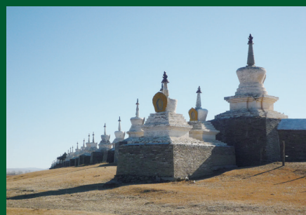
エルデニ・ゾー寺院(モンゴル) Erdene Zuu monastery (Mongolia)