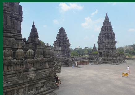
بران بانان(インドネシア) Prambanan (Indonesia)