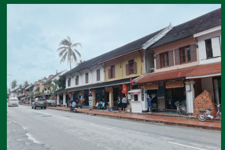
ルアンパバン(ラオス) Luang Prabang (Lao PDR)