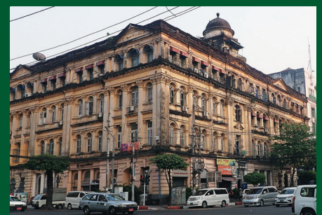
ヤンゴンの歴史的建造物(ミャンマー) Historical Building of Yangon (Myanmar)