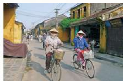
ホイアン市の町並みの様子