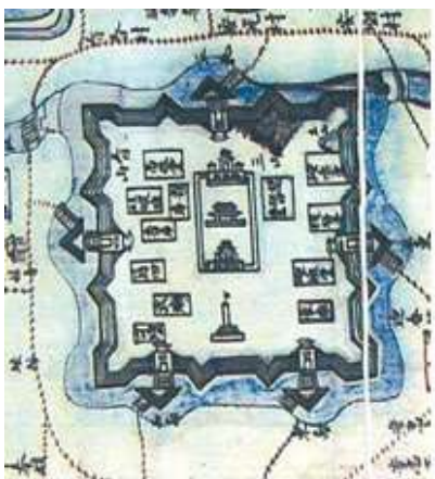
タンロン皇城の古地図