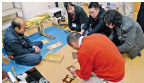
金箱の張り付け実習（日光社寺文化財保存会にて）