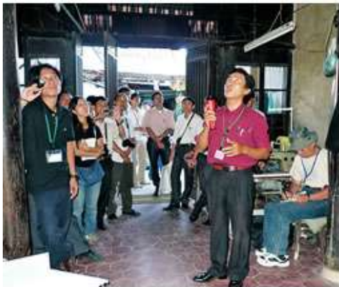
参加者による建物破損状態の説明