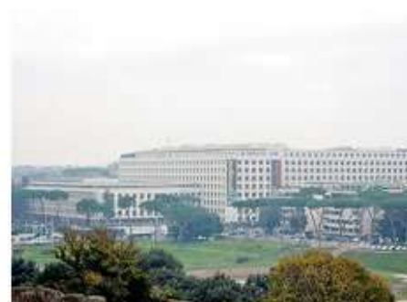
会場となったFAO（国連食糧農業機関）遠望

会議は、通常英語とフランス語の同時通訳で行うが、今回はスペインの費用提供により、スペイン語の通訳もあった。これでも分かるように、カリブ海諸国を含めた南米などスペイン語圏を対象とする事業を拡大していること、いま一つは、アフリカ諸国を意識的に取り上げる方向にあることが印象に残った。