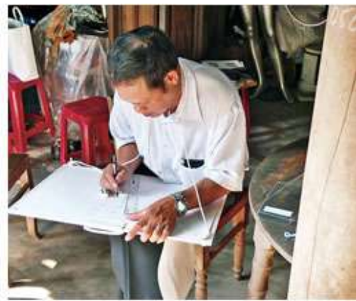
平面図の作成実習