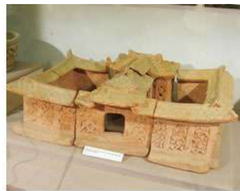
土製の出土品（ベトナム・タイビン省博物館所蔵）