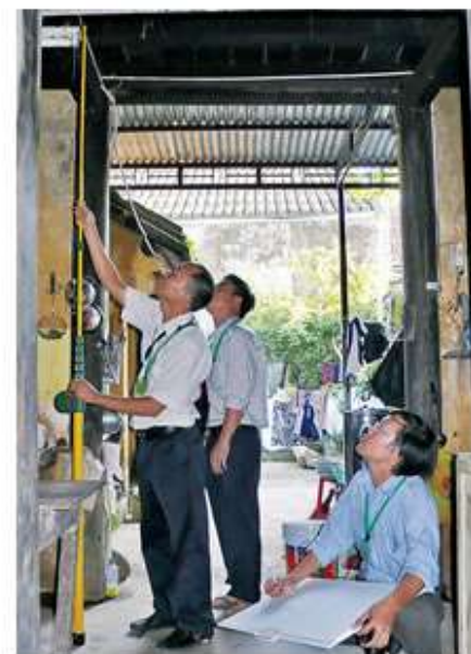
メジャーボールで部材の高さを測る