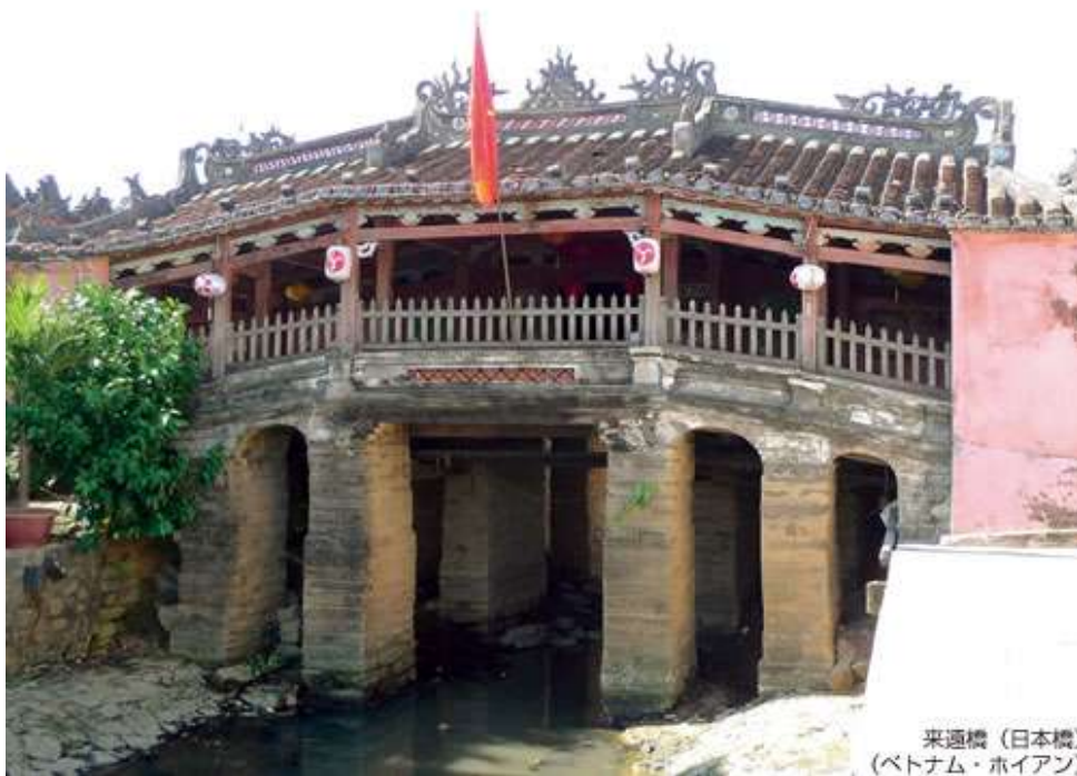
来通橋（日本橋） （ベトナム・ホイアン）