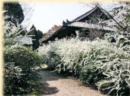
「大和一の雪柳」といわれる白い花が境内を彩る春の海龍王寺

木々のなかにひっそりと佇(たたず)む古刹(こさつ)「海龍王寺」は、飛鳥時代に毘沙門天(びしゃもんてん)を本尊として建てられましたが、731年に光明皇后により「海龍王寺」として改めて、創建されたお寺です。初代住持(じゅうじ)は、遣唐使の玄昉(げんぼう)です。玄昉は、唐から帰国途中、暴風雨に襲われましたが、一心に海龍王経を唱え、九死に一生を得て帰京し、「海龍王寺」の初代住持に任ぜられました。そのとき、寺号も「海龍王寺」と改められたと伝えられています。奈良時代より、遣唐使の安全祈願を行ってきた海龍王寺では、現在も、旅や留学の安全祈願に多くの参拝者が訪れます。