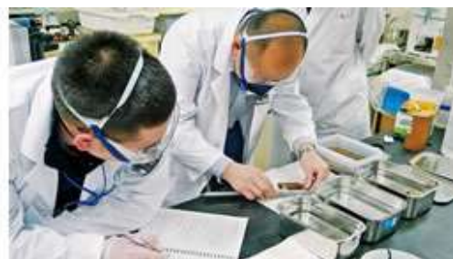
木製品の保存修復実習（奈良文化財研究所にて）