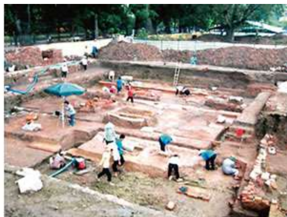
発掘調査が進むタンロン皇城遺跡