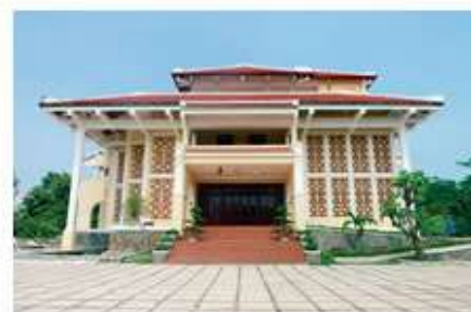
ワークショップ会場（ホイアン市博物館）