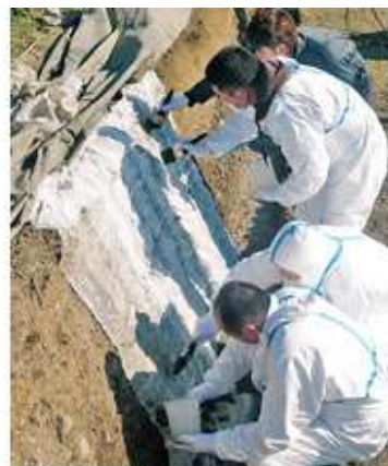
土層のはぎ取り実習（平城宮跡にて）