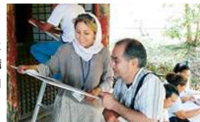
東大寺持仏堂で彩色の現状記録実習に 取り組む研修生

16名の研修生は、それぞれ文化省、博物館、研究所などに勤務し、木造建造物の保存・修復に携わる専門家です。研修では、講義・実習、さらに、事例に触れる機会としての臨地研修を多く取り入れました。研修生は、研修講師と熱のこもった意見交換を交わすなど、研修の成果を自国で活かそうと意欲的に取り組みました。