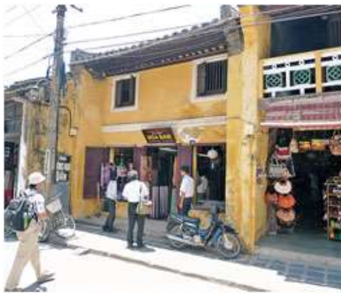
実習民家の1つ(チャンフー69番地民家)