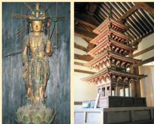
十一面観音立像(重要文化財) 五重小塔(国宝)

また、春になると、「大和一の雪柳」といわれる白い雪柳が境内を美しく彩ります。海龍王寺は、静かで緩やかな時の流れを感じながら、春を満喫することができる古刹です。