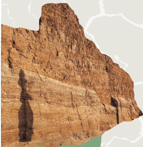
高松塚古墳 版築断面